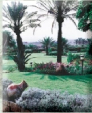
Aree verdi e sistemi di controllo dell'irrigazione