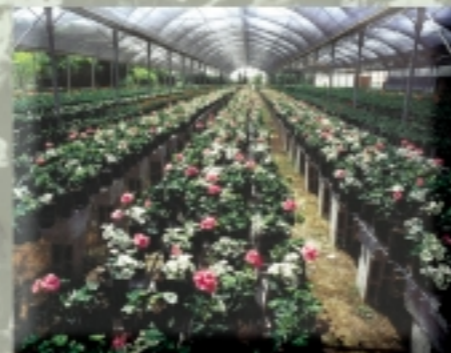
sistem di irrigazione per serre