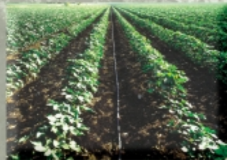
Sistem di irrigazione per l'agricoltura